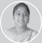
கேஷ்வர்தினி தொபஆ, அ.தொ.ப நெல்லித்தோப்பு